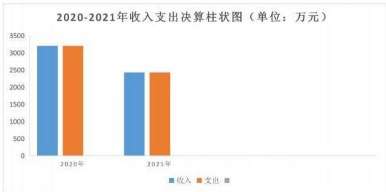
图 1：收入支出决算柱状图

本单位 2021 年度收入总计（含结转和结余）2428.87 万元。与 2020 年度决算相比，收入减少 776.4 万元，下降 24.22%，主要原因是：首先 2021 年实施预算一体化平台，县本级项目结余不在结转，其次我院政法基础设施建设- 审判综合楼项目收入减少。本部门 2021 年度支出总计（含结转和结余）2428.87 万元。与 2020 年度决算相比，支出减少 776.4 万元，下降 24.22%，主要原因是：我院政法基础设施建设-审判综合楼项目支出减少。