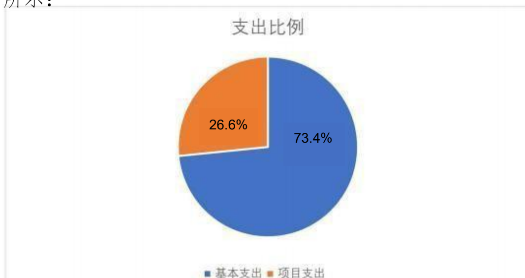
图 1：支出构成情况（按支出性质）

本部门 2019 年度本年支出合计 611.22 万元，其中：基本支出 448.41 万元，占 73.40%；项目支出 162.82 万元，占 26.60%；如图所示：