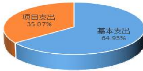
图 2：支出决算构成情况（按支出性质）