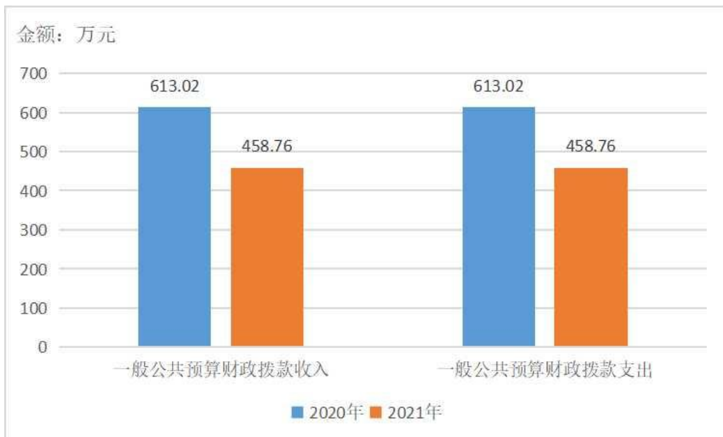
2020 年与 2021 年财政收入支出对比情况