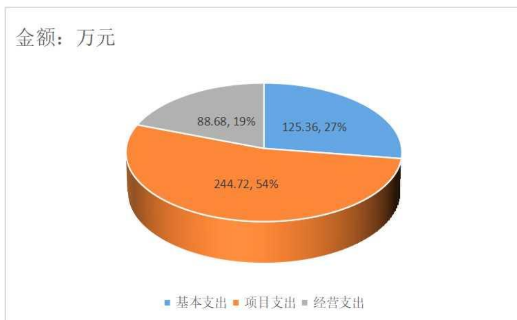
2021 年度支出占比情况