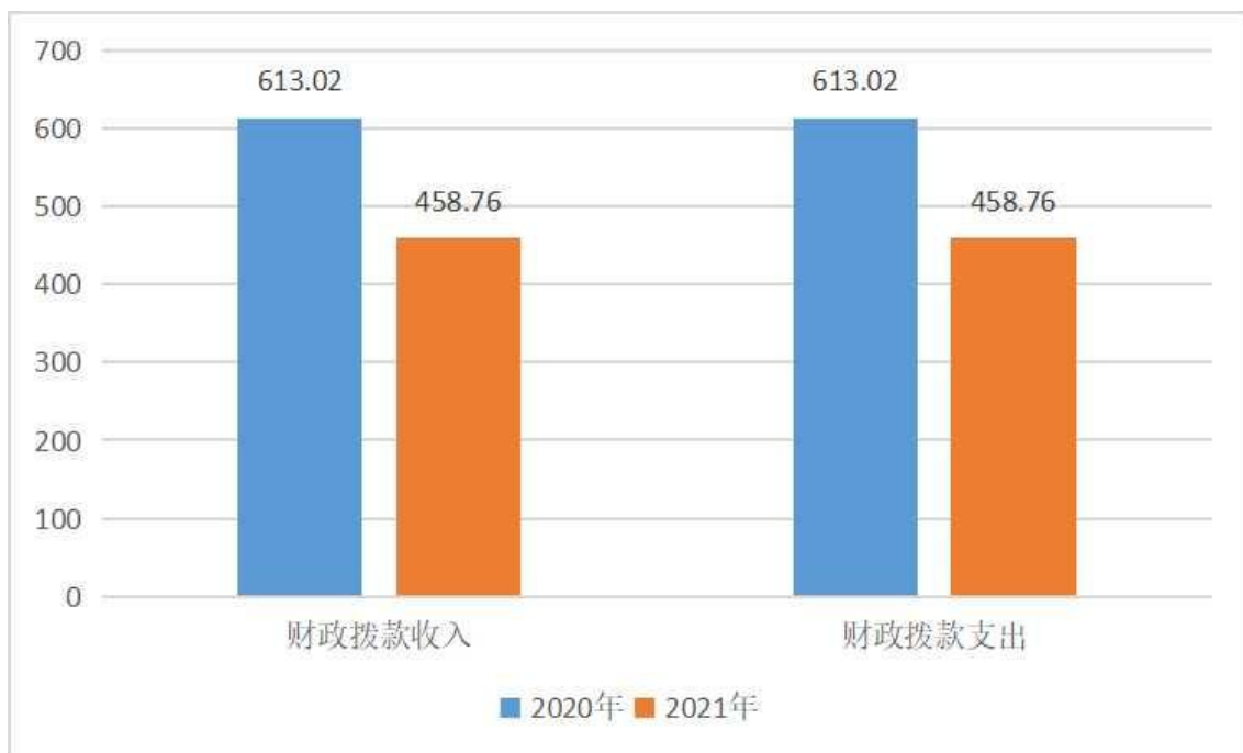
2021 年与 2020 年财政拨款收支情况